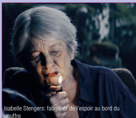
Isabelle Stengers: fabriquer de l'espoir au bord du gouffre