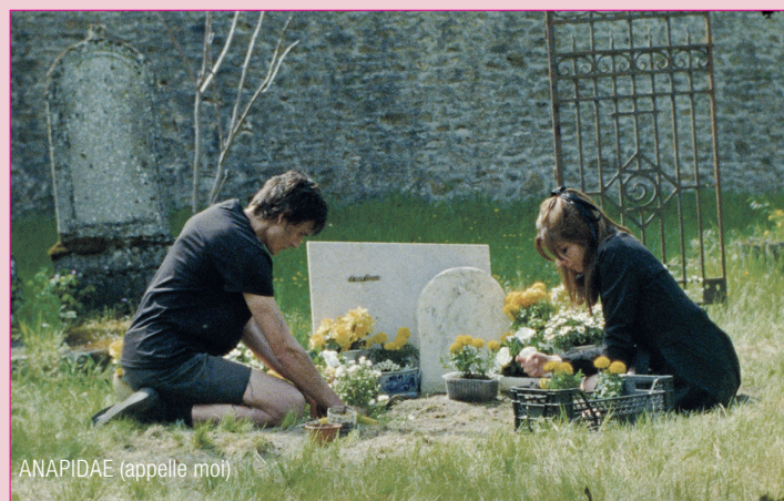
ANAPIDAE (appelle moi)