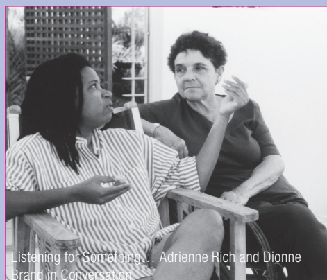
Listening for Something... Adrienne Rich and Dionne Brand in Conversation

Sexta-feira 11 outubro • Batalha, Cafeteria & Bar, 19h30